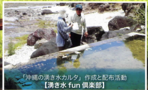
「沖縄の湧き水カルタ」作成と配布活動 【湧き水 fun 倶楽部】