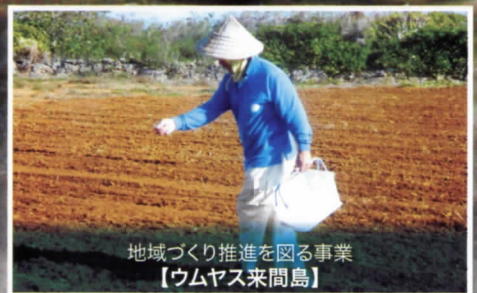
地域づくり推進を図る事業 【ウムヤス来間島】