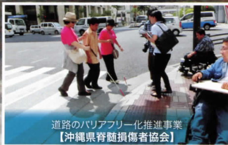
道路のバリアフリー化推進事業 【沖縄県脊髄損傷者協会】