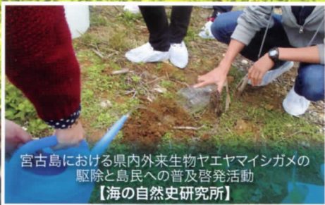
宮古島における県内外来生物ヤヤマシガメの 駆除と島民への普及啓発活動 【海の自然史研究所】