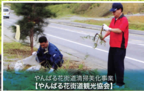
やんばる花街道清掃美化事業 【やんばる花街道観光協会】